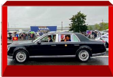
※この写真はこの日休みのスタッフから送られてきたものです